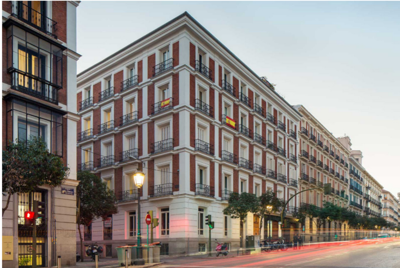
Un proyecto de Rehabilitación de viviendas .

Bárbara de Braganza 8 , es un proyecto de nueve viviendas y dos locales comerciales y garaje robotizado para 40 vehículos, en régimen de cooperativa que combina a la perfección tradición y modernidad en un representativo edificio del centro de Madrid