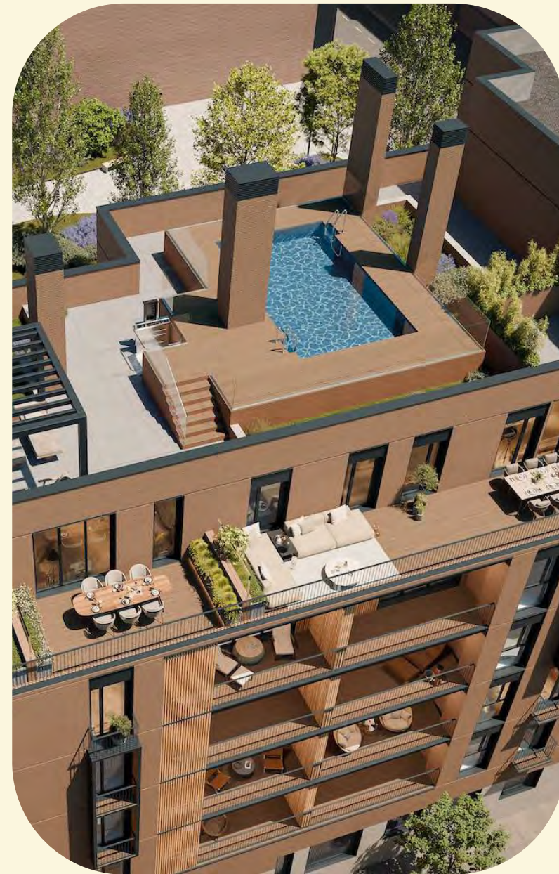
→ Mazarredo 18 Evela