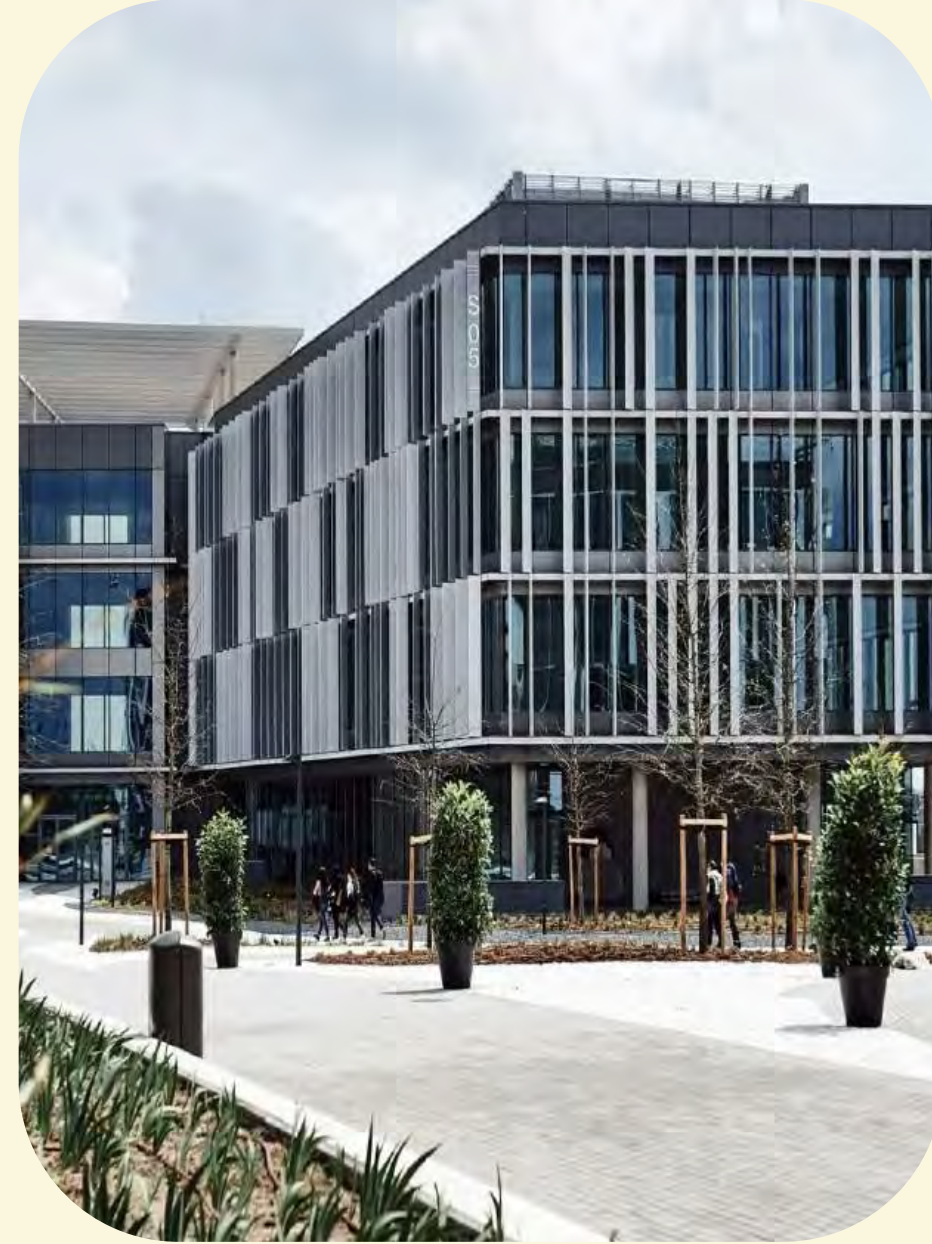
→ Oficinas Airbus