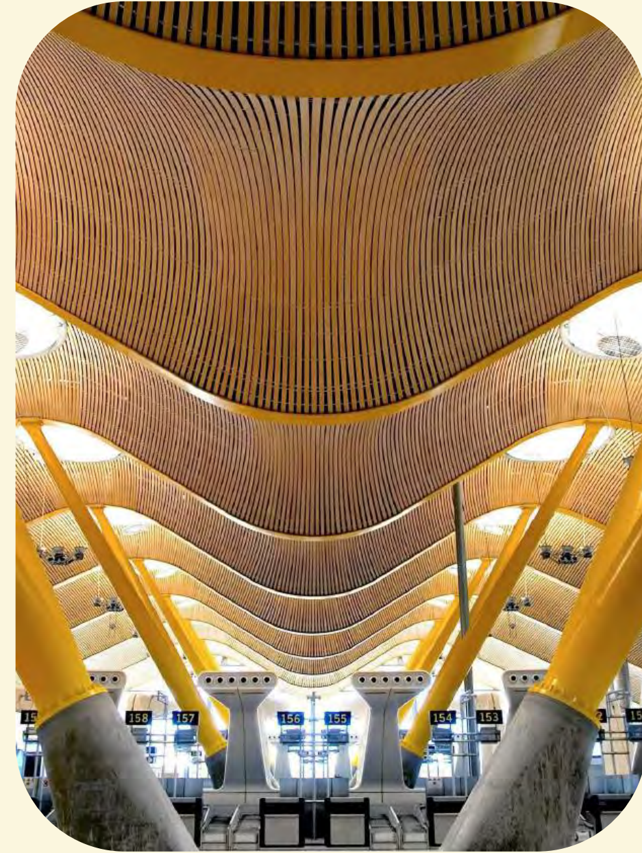
→ T4 Aeropuerto Madrid Barajas