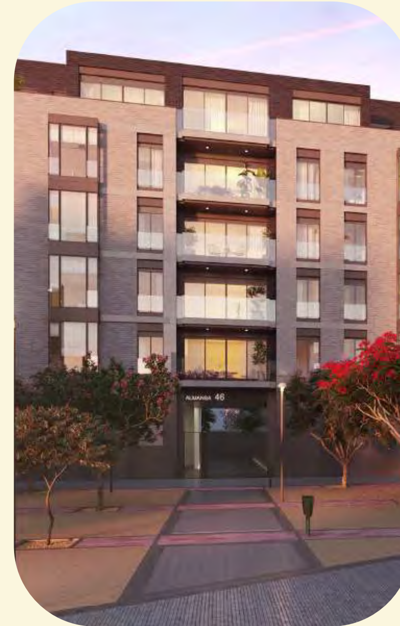
→ Jardines de Cuatro Caminos