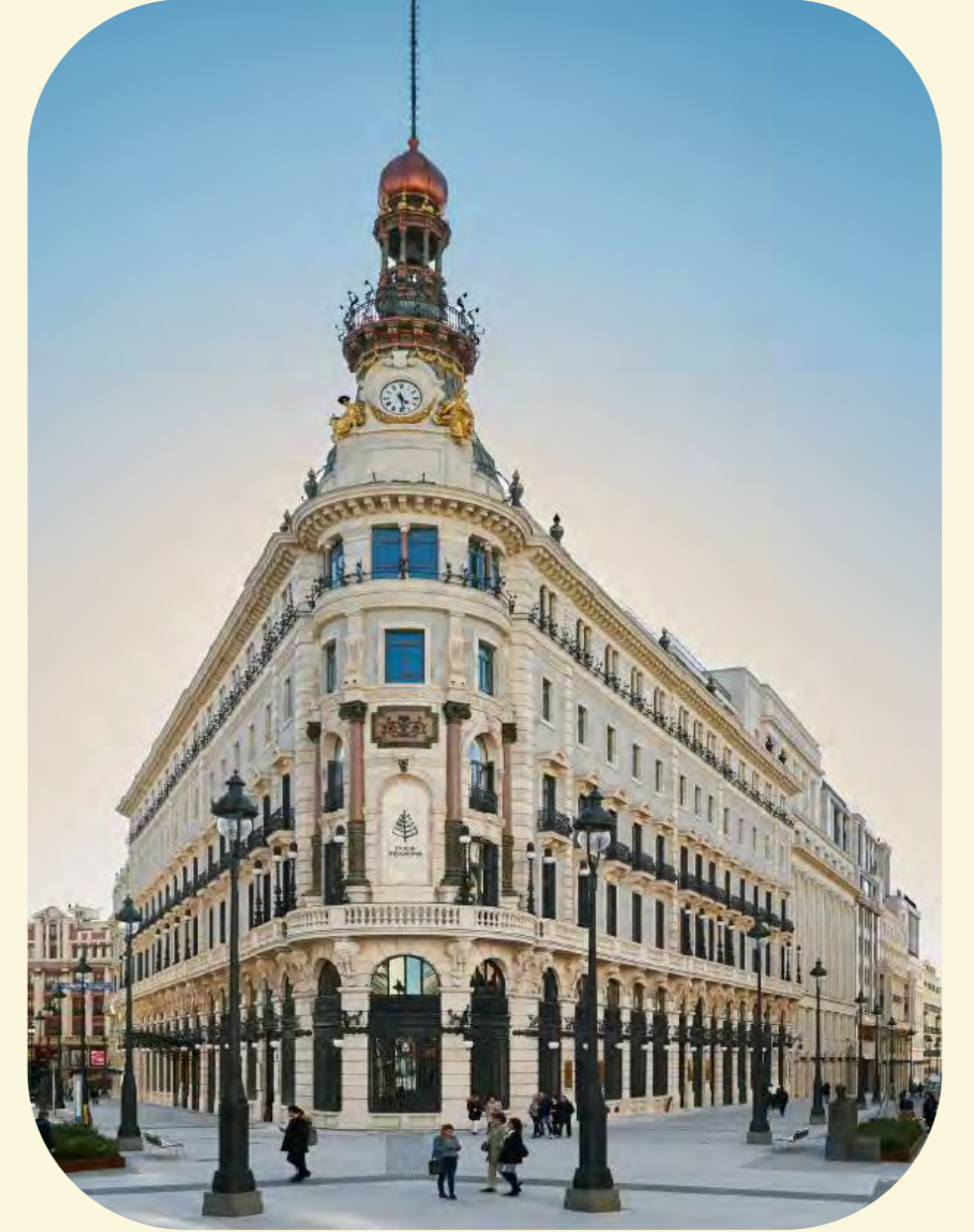
→ Centro Canalejas Madrid