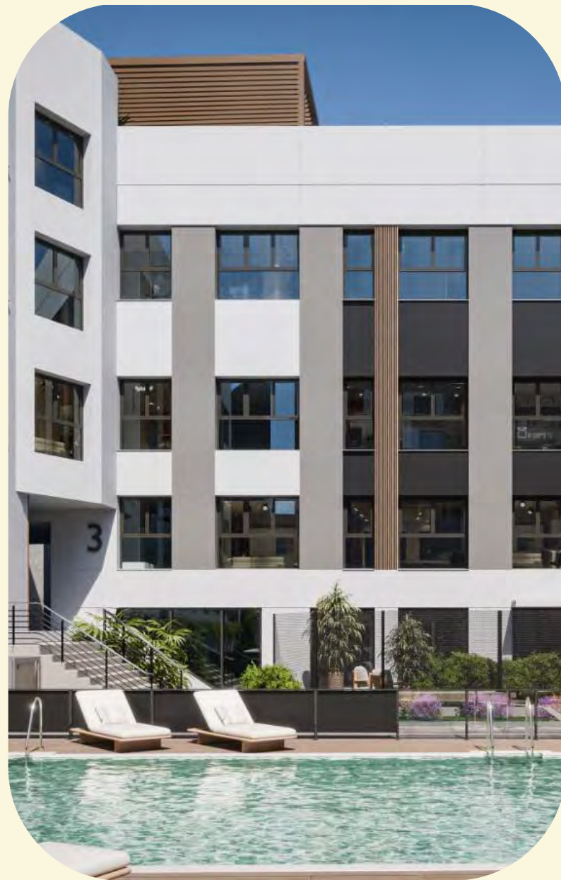
→ San Enrique 3 Serentia Gardens