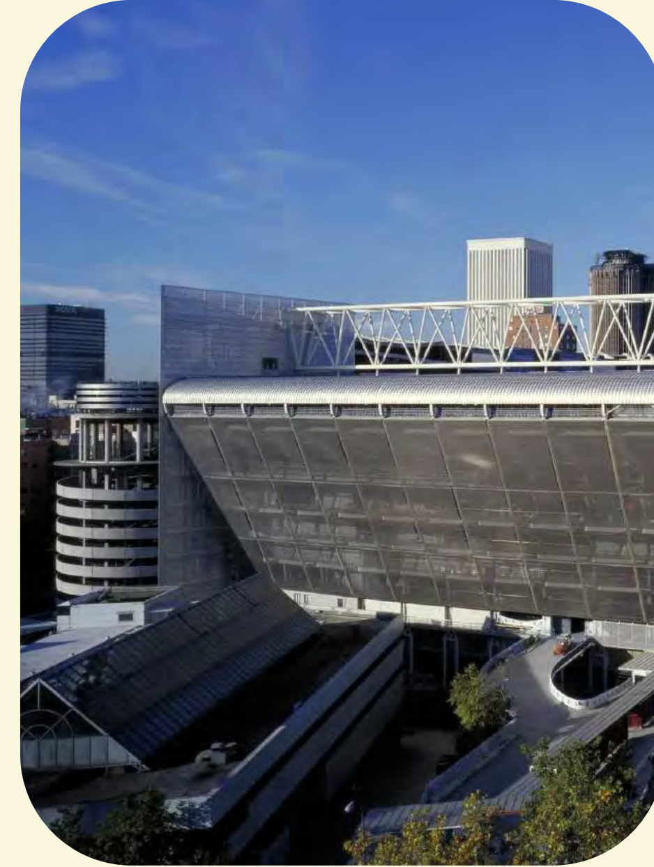
→ Estadio Santiago Bernabéu