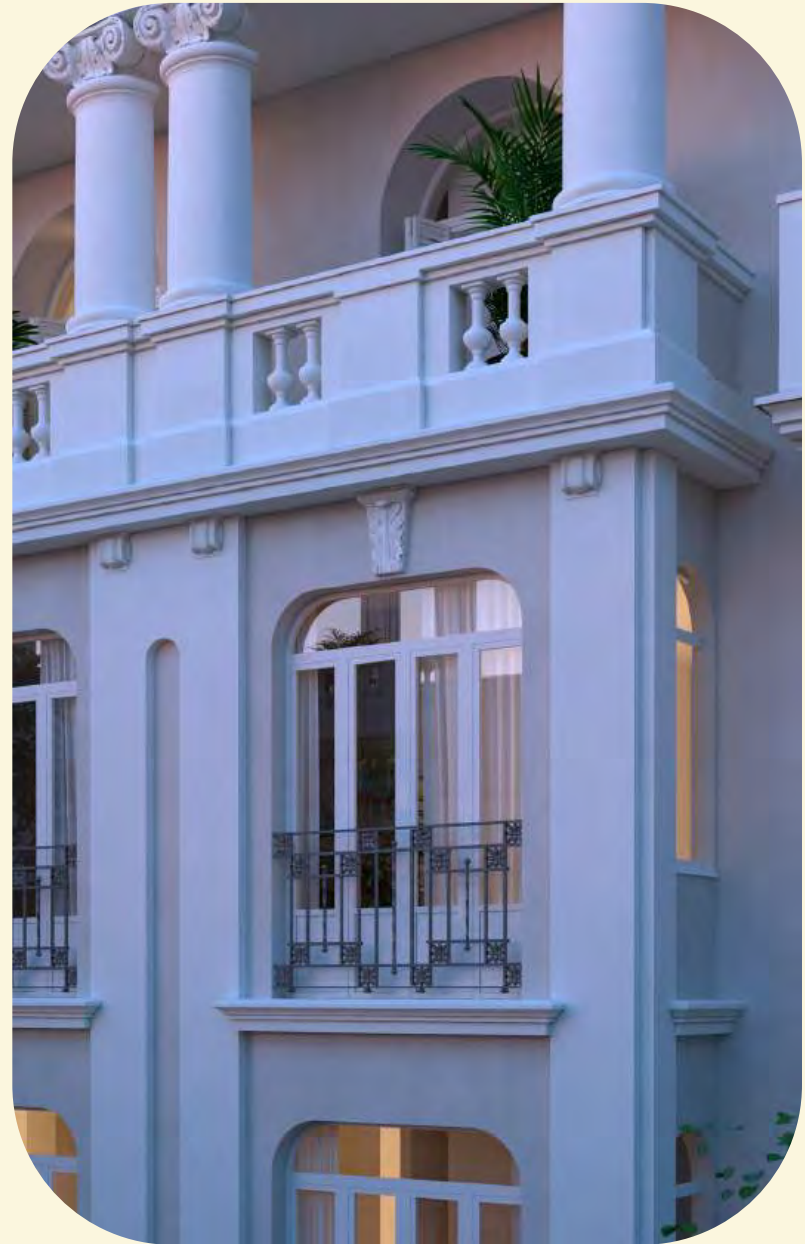
→ Hermosilla 67