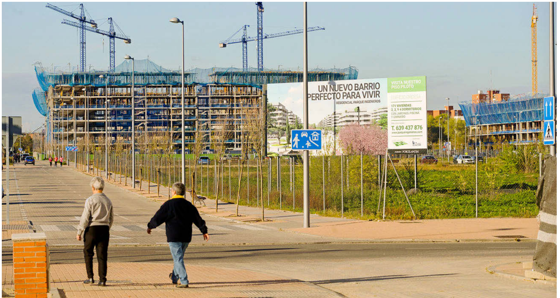
Bloques de pisos en construcción en Parque Central de Ingenieros, el nuevo ámbito que crece en el distrito de Villaverde, al sur de Madrid capital, que albergará casi 2.000 viviendas. JOSÉ S. GUTIÉRREZ